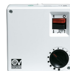
SCRR5 Codice 12963